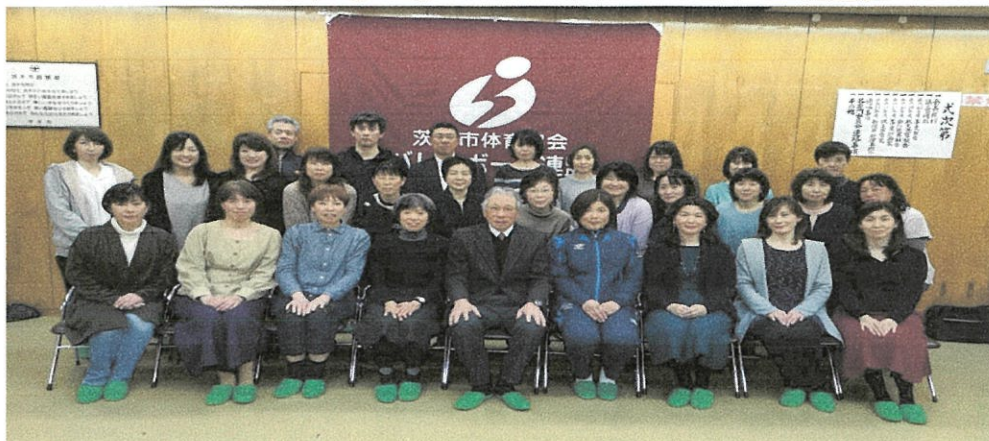
茨木市バレーボール連盟創立55周年記念式典 平成28年12月16日 茨木市役所南館9F